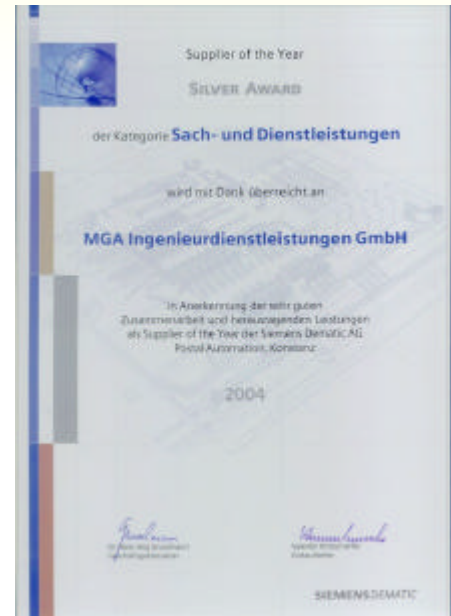
Urkunde - Silver Award als Supplier of the Year

Abgerundet wird unser Leistungsspektrum durch Beratungsleistungen speziell im Bereich von Logistikanlagen sowie durch Seminare, die wir gerade unter diesem Aspekt für SIEMENS-eigene Mitarbeiter anbieten.