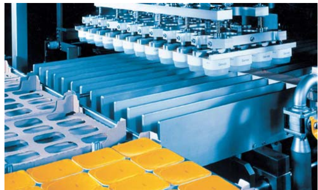
Verpackungsmaschine Nahrungsmittelindustrie