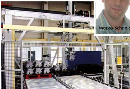
Grob Werke, Portalroboter